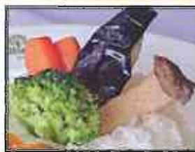
温野菜 人参・ブロッコリー なす・エリンギ 税込330円