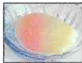
温度卵又は目玉焼 税込220円