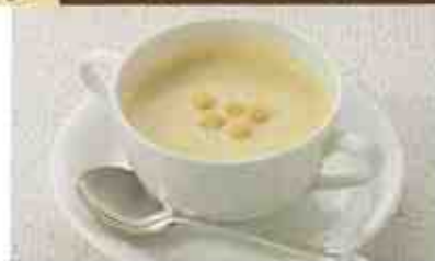
日替わりカップスープ