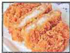
ポークカツ 税込550円